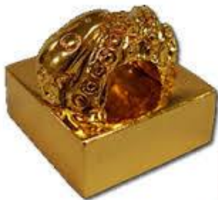
金印 (福岡市博物館所蔵)