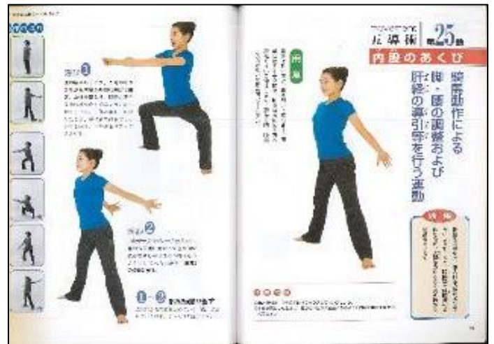
近藤さんが使われている体操のテキストの一部

入会して数か月で首や肩のこりが解消し、運動後もすっきりと気持ち良く、これは自分にぴったりの体操だと納得されたそうです。今でも週に1回の練習を欠かさず、体調を整える一方、指導員補の資格も取得して後進の指導にあたられています。