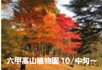
六甲高山植物園 10/中旬～

そこで三田の近くで紅葉のキレイなところを探してみました。11月初旬頃から色づくところが多ですが、六甲高山植物園などは10月中旬ごろから色づき始めるそうです。(下の写真の時期は色づき始める頃)