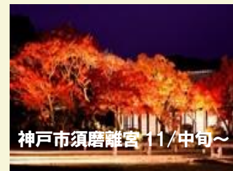
神戸市須磨離宮 11/中旬～

この他、三田の三田谷公園・神戸市立森林植物園等・三田周辺では11月上旬頃から色づき始めますが、健康のためにもお出かけされてはいかがですか？ (A・O記)