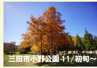
三田市小野公園 11/初旬～