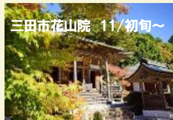
三田市花山院 11/初旬～