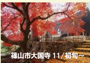
篠山市大國寺 11/初旬～