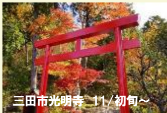
三田市光明寺 11/初旬～