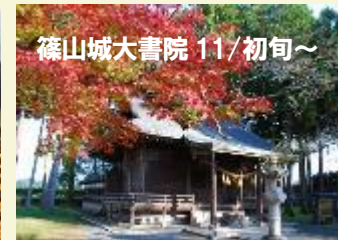
篠山城大書院 11/初旬～