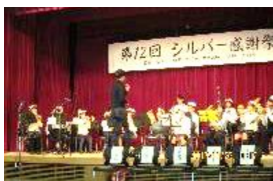
三田ジュニアバンド

第12回シルバー感謝祭は例年通り、11月23日（勤労感謝の日）にウッディタウン市民センターで開催されましたが、前日の雨の影響で、芝生広場での「バザー」や「演技」は中止となり、館内だけの開催となりました。