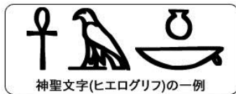
神聖文字(ヒエログリフ)の一例

ピラミッドの近くなど、石に彫られました。後、パピルス(葦の葉を加工した紙)にも書