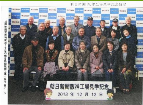
三田市シルバー人材センター高平地域班の皆さん

12月12日(水)朝7時45分に、高平ふるさと交流センターを出発。高平地域班の半数を超える24名が参加しました。