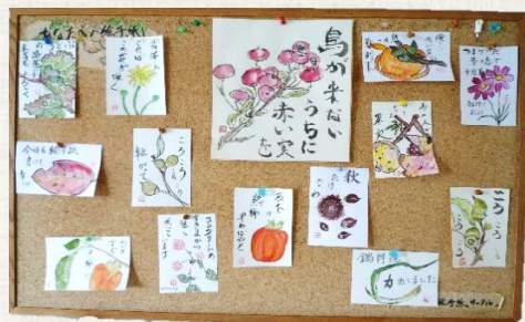
シルバー人材センター内フロアー 作品展示中 '16/11/1 撮影

事務所2階の一角で、癒しのコーナー となっている、絵手紙作品。 今回は、その製作風景を見学させて頂 きました。