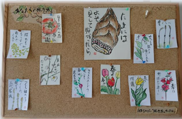
シルバー人材センター事務所 2階ロビー 2017.5.2撮影