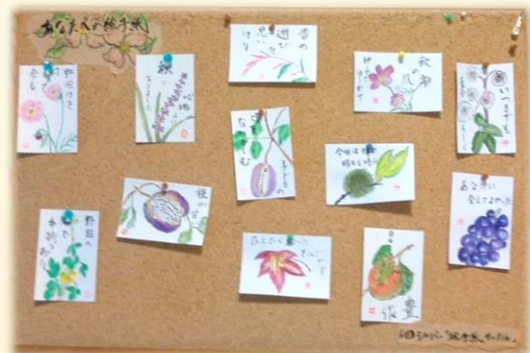
シルバー人材センター事務所2階ロビー '18/9/28 撮影