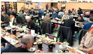
かに会席に舌鼓・・・！